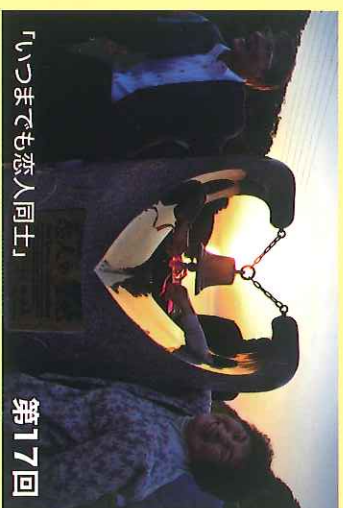
「いつまでも恋人同士」